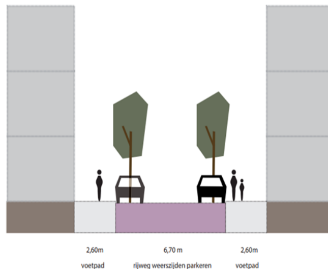
Profiel 12 meter meerendeel van de straten

Op dit moment wordt de Bomenbuurt-visie afgerond, waarin thema-kaarten zijn opgenomen waarmee de gehele Bomenbuurt als het ware wordt beschreven (mobiliteit, groen, hittestress, waterberging etc.). Zodra deze visie openbaar is (vermoedelijk begin 2021), dan kan deze door SIR worden verspreid.